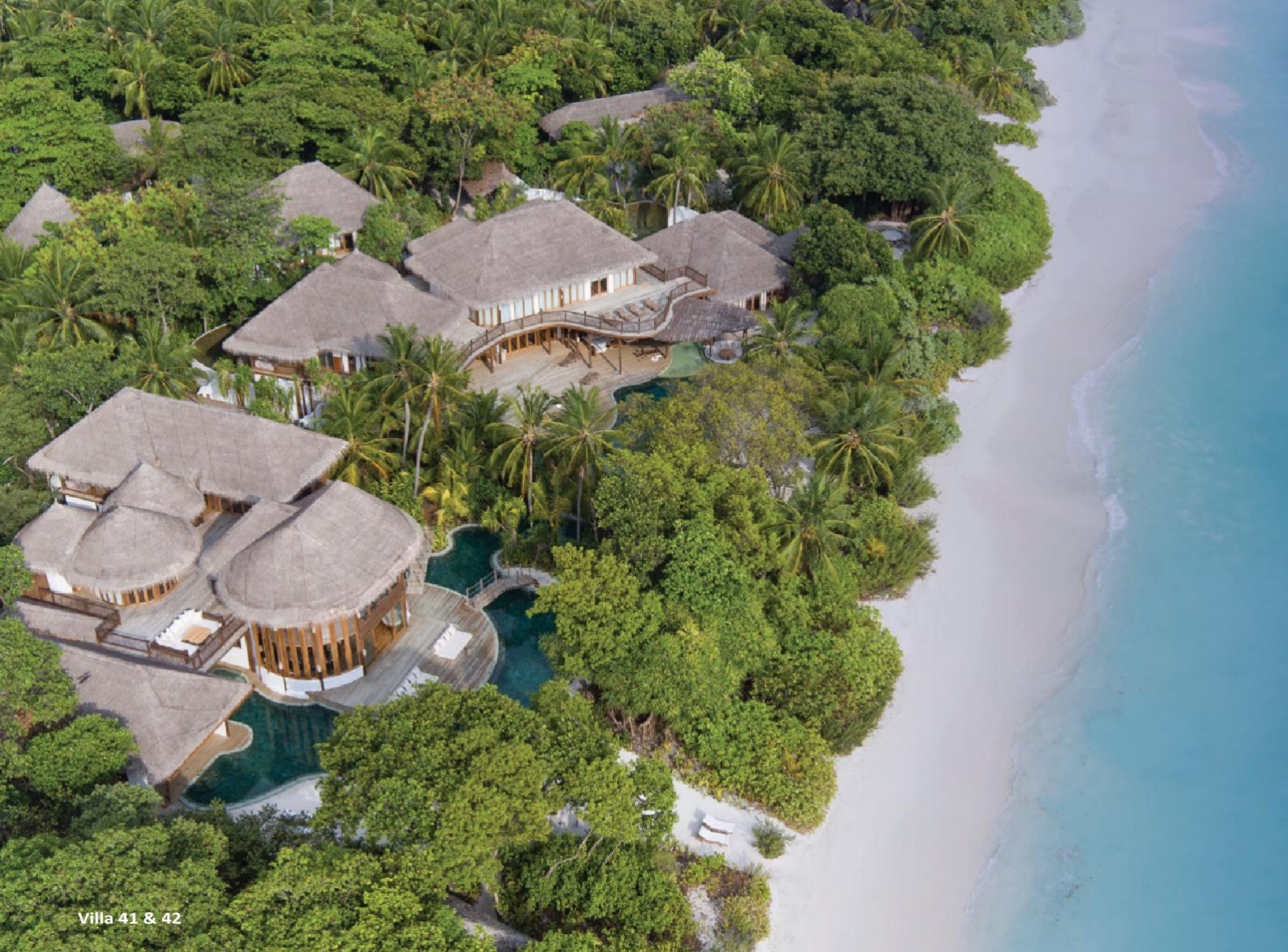
Villa 41 & 42